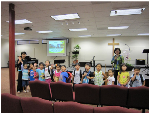
(2010-2011년 가을 학기 개강식)